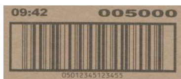
Limpador da cabeça de impressão lig.