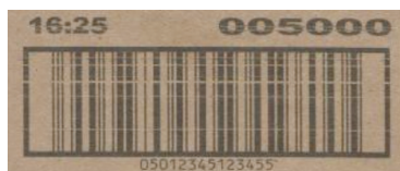
Limpador da cabeça de impressão deslig.