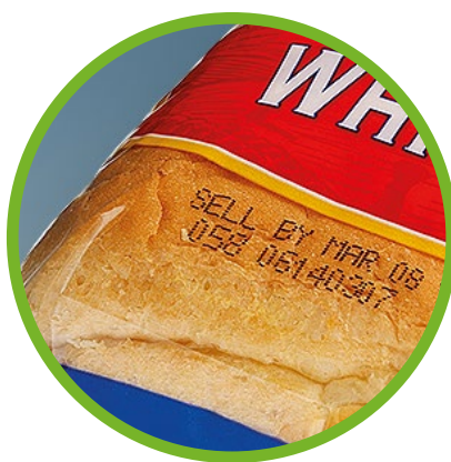
Produtos de panificação e cereais