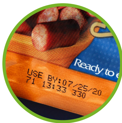
Carnes e aves