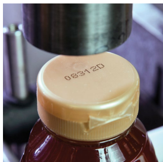
Código de jato de tinta sobre garrafa plástica