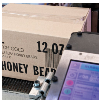
Videojet 2350 imprimindo em caixas de transporte