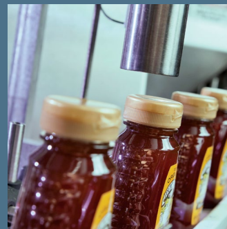
Videojet 1510 imprimindo on-line

A Dutch Gold Honey continua recebendo cada vez mais requisitos de codificação a cada ano e sempre é capaz de atender às necessidades mutáveis de seus clientes. O sistema CLARISUITE permite que a empresa se expanda e proporciona a comodidade de saber que todas as informações estão corretas e atendem às necessidades dos clientes.