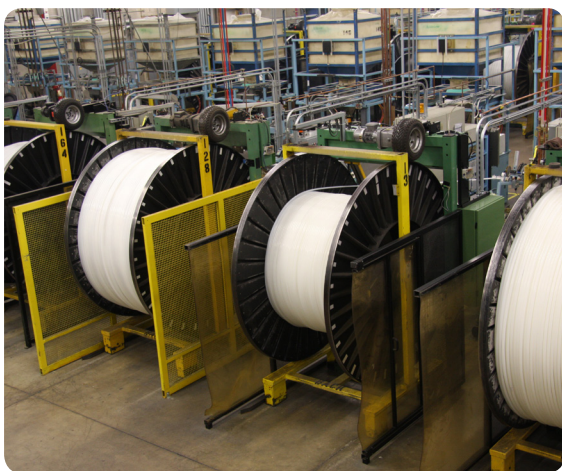
Carretéis de tubos na instalação da Uponor em Apple Valley, MN.